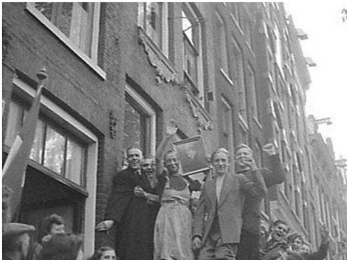
Kaalscheren van 'moffenhoeren'