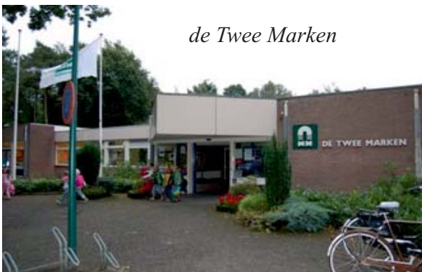
de Twee Marken