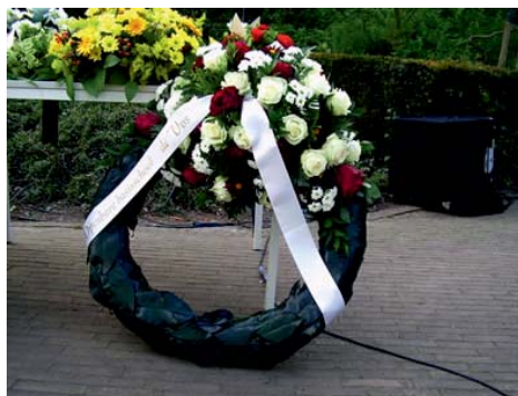
herdenken juni 2012