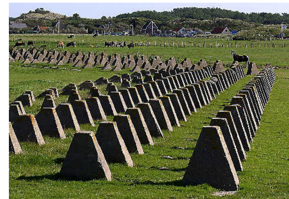
Ook voor tankversperringen zoals deze werd bouw materiaal aangevoerd.