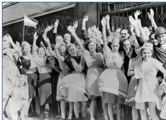
De vreugde na de bevrijding van de geallieerden

De bevolking daar moest in de laatste fase van de oorlog de hongervinter zien te overleven.