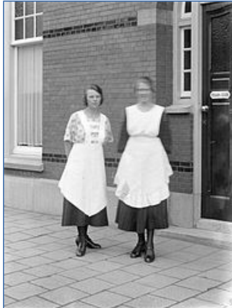
Twee Duitse dienstmeisjes in Nederland

veranderde deze Nederlandse vrouwen waren ontevreden dat de hun banen, maar ook hun was er het geloof dat de welvaart en de eigen markt bedreigde. immigranten alleen met een werkvergunning. kregen het zwaarder, geleidelijk aan niet meer opkomst van het de oorlogsdreiging Ze werden gezien als uitbreken van de oorlog verder op. echter al zo lang in inmiddels volledig waren zelfs de Nederlandse