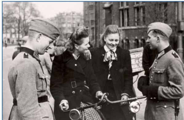
Duitse militairen praten met Nederlandse vrouwen

Door het toenemende verzet tegen de bezetter vertoonden Nederlandse vrouwen zich niet meer samen met Duitse militairen. De vrouwen zagen hun mannen vaak in het geheim, omdat de familie en de rest van de Nederlandse bevolking de omgang met de vijand verafschuwde.