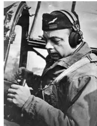
Antoine de Saint-Exupéry

De werkelijkheid is er een van verbroken verbindingen, letterlijk en figuurlijk, van geruchten en boodschappen die allemaal tot hetzelfde vlak zijn teruggebracht: er lijdten 10 miljoen Fransen honger, de stad Blois staat in brand, uw chauffeur is teruggevonden.